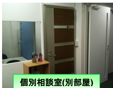
個別相談室(別部屋)